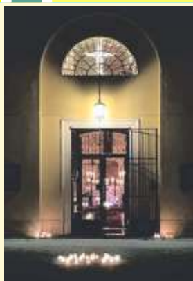
1000 Lichter SY