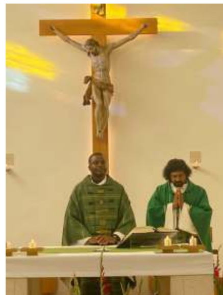
Vorstellungsmesse in der Oberlisse

E-Mail: Luke.Eziukwu@katholischekirche.at