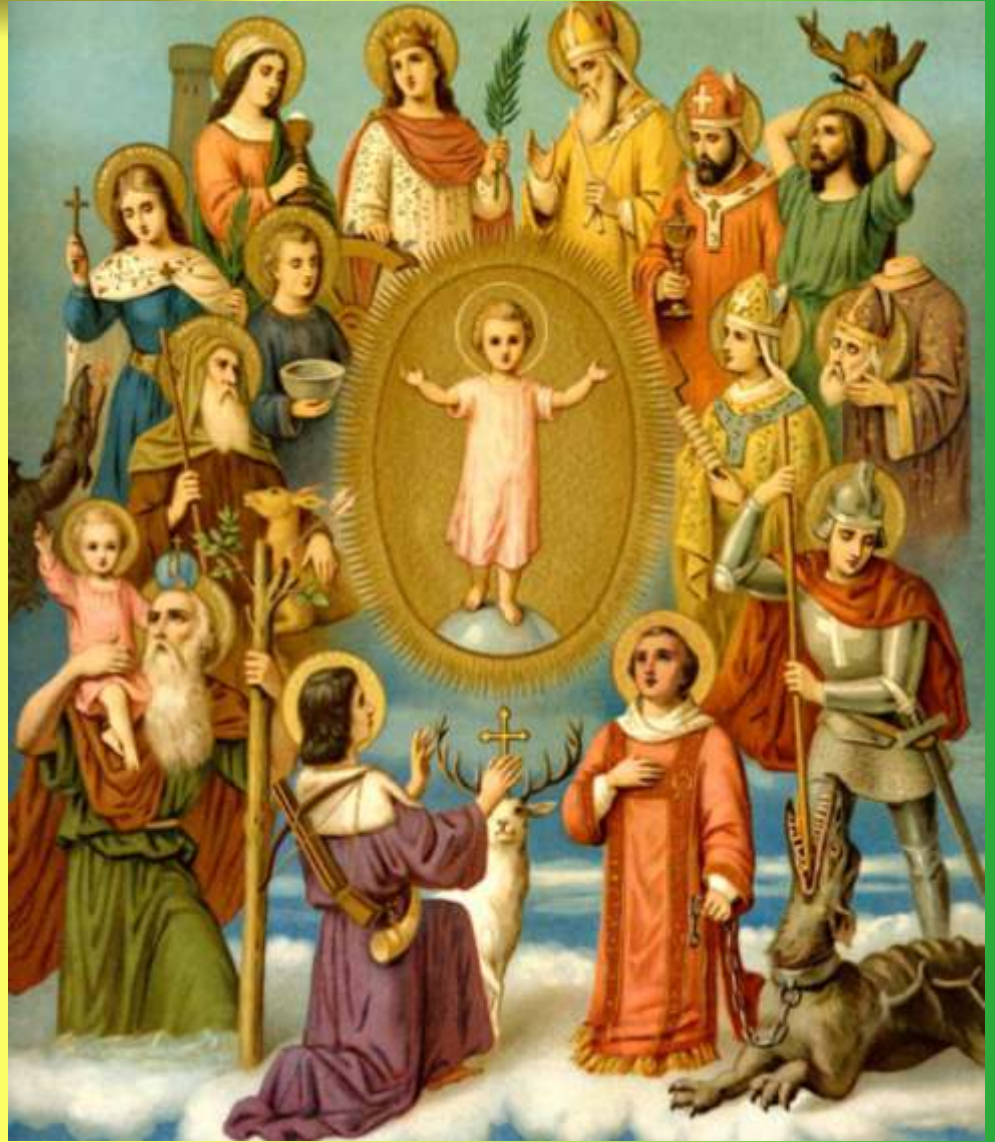
14 Nothelfer: Achatius, Ägidius, Barbara, Blasius, Christophorus, Cyriacus, Dionysius, Erasmus, Eustachius, Georg, Katharina, Margareta, Pantaleon, Vitus

https://de.wikipedia.org/wiki/Vierzehn_Nothelfer