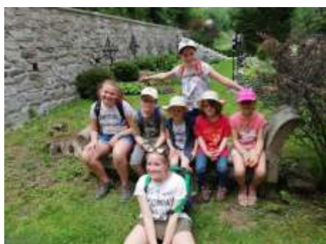
Große Wiedersehensfreude der Minis!

Bei einer Abschluss Show trafen sich wieder alle Minis im Zelt und konnten die Erlebnisse des Tags Revue passieren lassen. Ausflüge und Minitage sind in der Arbeit mit Kindern in der Kirche wichtig für das Gemeinschaftsgefühl und machen bewusst daß, es etwas ganz Besonders ist eine Ministrantin oder ein Ministrant zu sein.