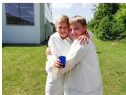
Die neuen Mini T-shirts