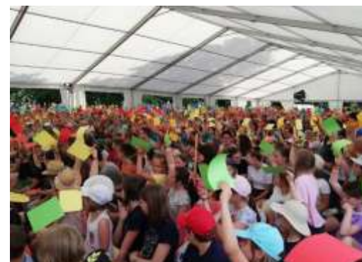
Abschluss Show im großen Zelt!