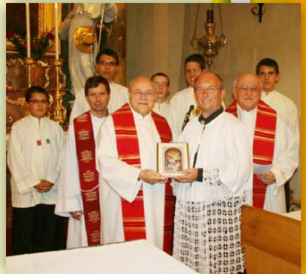
Geschenkübergabe in Gerasdorf

Herausgeber: Ausschuss für Öffentlichkeitsarbeit der Röm.-kath. Pfarren Gerasdorf und Seyring Alle: Gerasdorf, Kircheng.1; Tel. 02246/2267, FAX 2267-18 Bankverbindung: für Gerasdorf KtNr. 600.122 RRB Gänsernd. BLZ 32092 für Seyring KtNr. 350056-80000 VB Obersd. BLZ 44.570 Neue Rufnummer: 0664/6101361 für alle Pfarren und Filialkirchen Mobile Ruf.Nr.: Pfr. Mod.: Branko 0664/4449271 PAss.: Susanne 0664 8243639